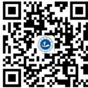
学生缴费平台二维码